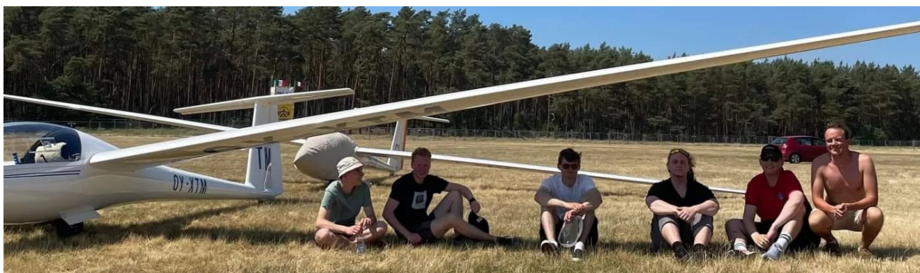
De danske deltager venter på konkurrence start i skyggen fra svæveflyet vinge.